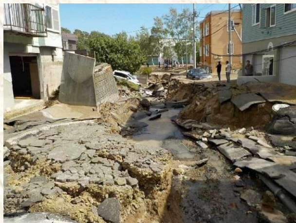
①住宅街での道路の著しい変状 (近くの上水道管φ200mm、φ500mm が破損)

札幌市清田区里塚周辺の土地利用について 札幌市清田区里塚災害地周辺の航空写真