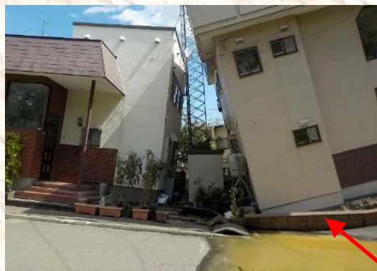
④里塚中央ポプラ公園そば の家屋が傾斜