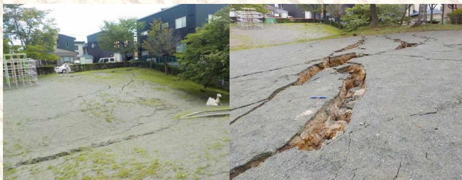
③里塚中央ポプラ公園 公園中央部でV字に変形・亀裂