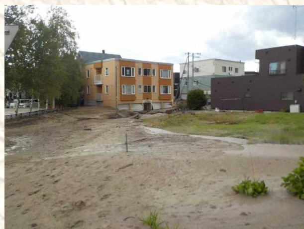
⑤土砂(火山灰土)が流動化して市道に堆積