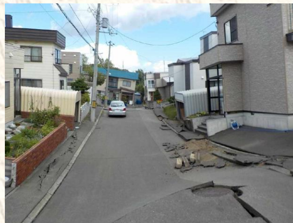
②住宅街での道路の陥没